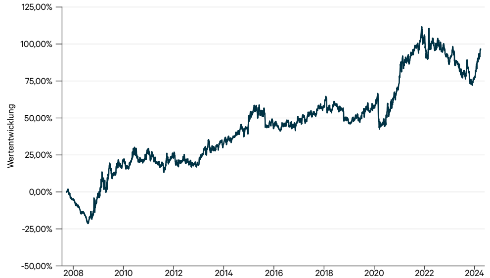
— C-QUADRAT ARTS Total Return Dynamic T (PLN)