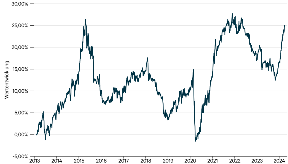
— C-QUADRAT ARTS Total Return Balanced T (CHF hedged)