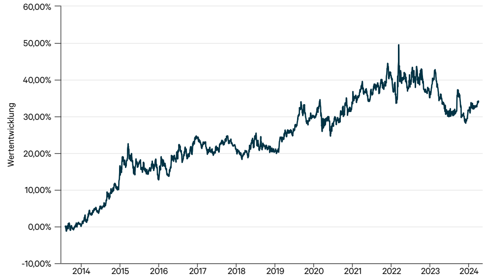
— C-QUADRAT ARTS Total Return Bond VTA (PLN)