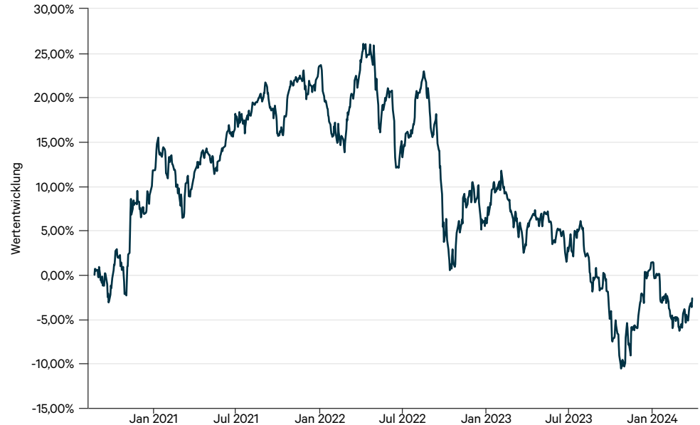
— FAROS Listed Real Assets AMI C (a)